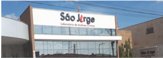
Laboratório São Jorge, de Bariri, tem convênio com Sindicato da SaúdeJaú: 25% de desconto